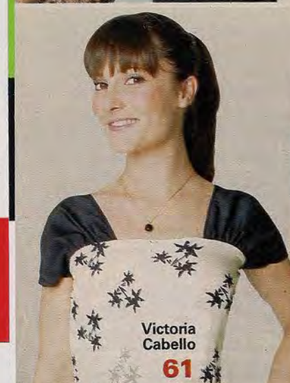
Victoria Cabello 61